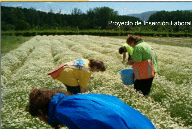
Proyecto de Inserción Laboral