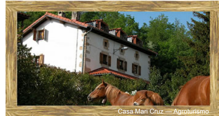
Casa Mari Cruz — Agroturismo

El fondo de solidaridad paz y esperanza ha establecido un Convenio de Colaboración con FIARE para la creación de un “Fondo Especial que frene los efectos de la crisis económica” y posibilite el trabajo socialmente útil a personas desempleadas; al cual irán destinados los intereses de todas las libretas Fiare REDES cuyos titulares opten por este proyecto. Esta es una buena manera de contribuir a la promoción del empleo de personas y colectivos excluidos social y económicamente. Otras asociaciones o entidades también puede suscribir un Convenio con Fiare para difundir la libreta REDES, por una parte; y apoyar un proyecto de alto interés social o medioambiental, por otra.