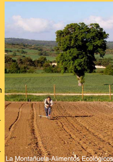
La Montañuela-Alimentos Ecológicos

Pone el ahorro solidario y ético al alcance de los jóvenes y las personas con pocos ingresos para que la cuantía inicial no sea un freno a la ilusión y a la posibilidad de colaborar con este proyecto radicalmente transformador de la sociedad.